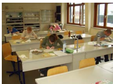
NAWI SCHW BU1